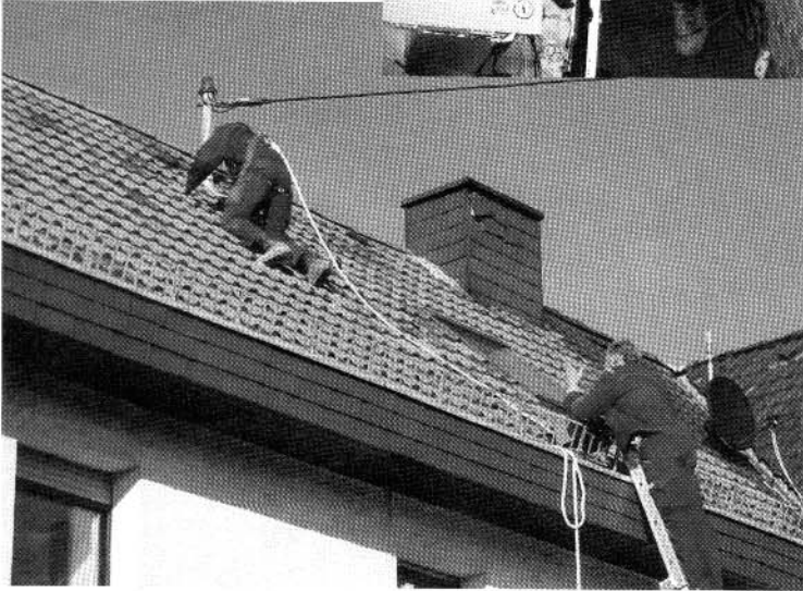
Ob im Bad, Heizungskeller oder auf dem Solar-Dach – die qualifizierten Fachkräfte von PS-Gebäudetechnik sorgen für die sichere Ausführung.