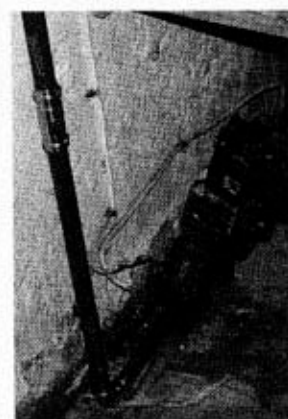
Das neue Steinleitungs-Rohr